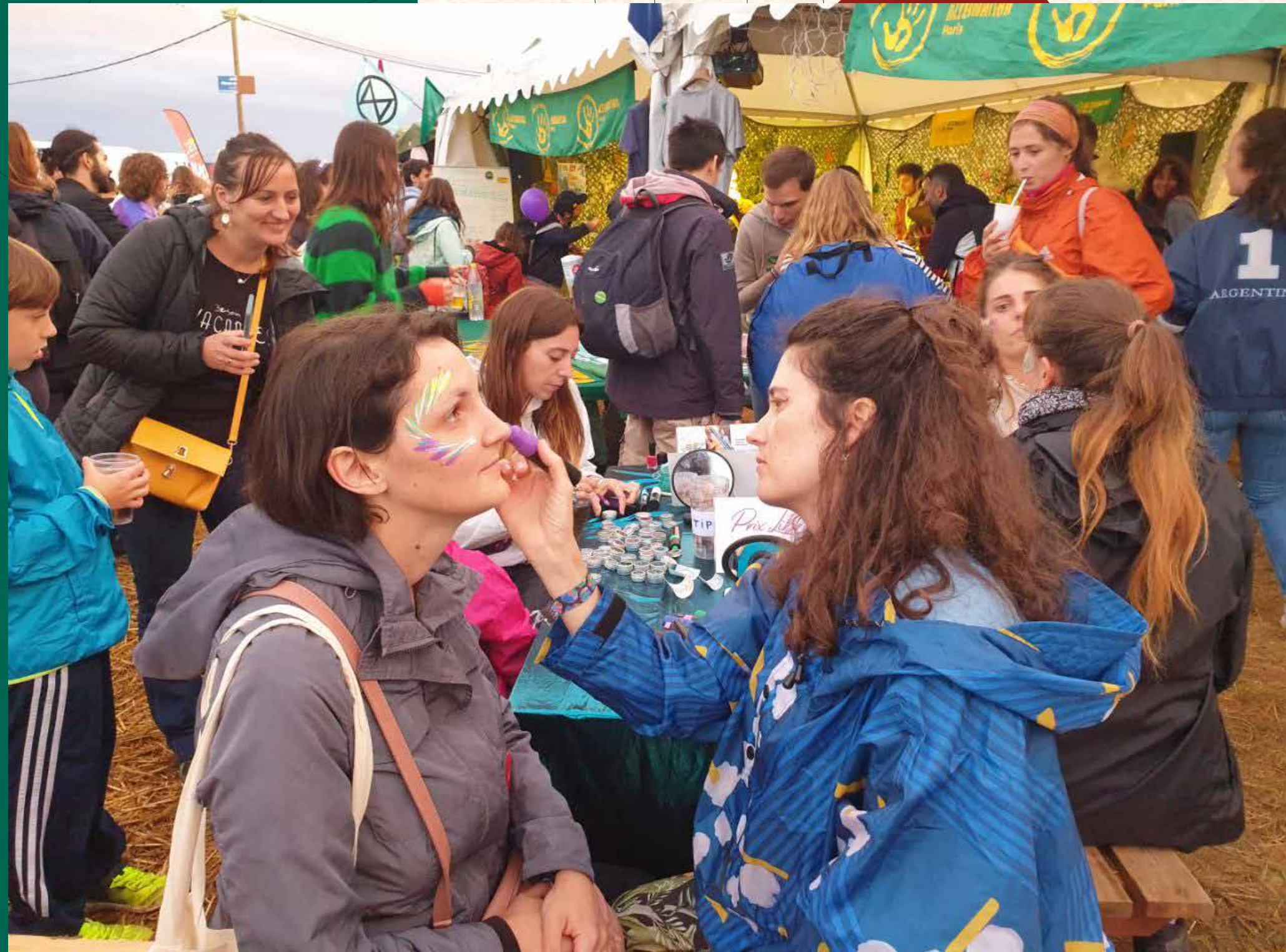
Stand Alternatiba à la Fête de l'Humanité 2022 (concerts, stand-ups, boutique militante, pose de paillettes ...)