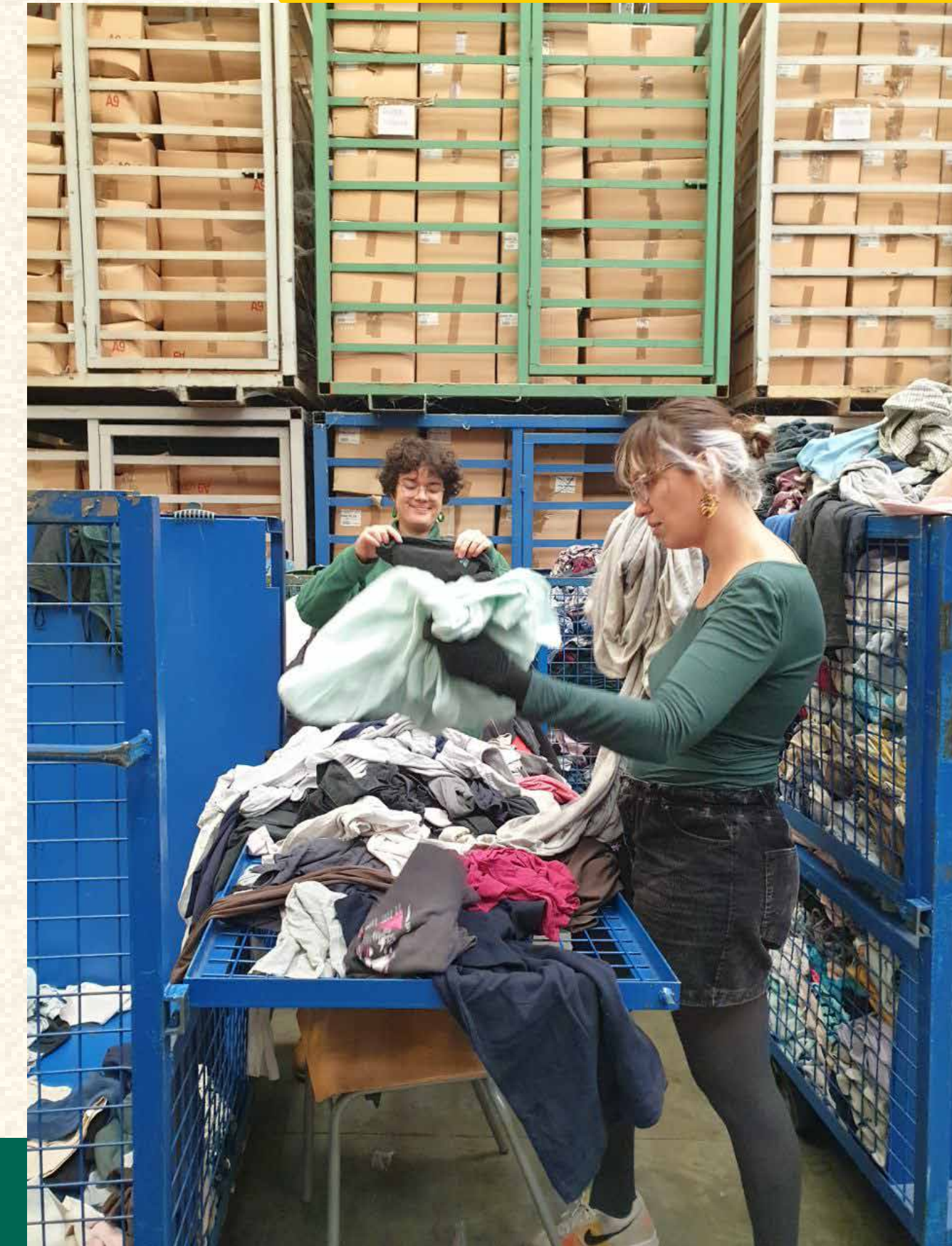
Mission réapprovisionnement textile au Relais Val de Seine

Notre stock, sans cesse rafraîchi, de plusieurs centaines de kilos de textile nous permet de répondre à la plupart des attentes de nos client·es. Quant à l'impression, nous pouvons sérigraphier des illustrations complexes et de plusieurs couleurs , qui peuvent être adaptées aux contraintes de la sérigraphie par nos graphistes professionnel·les.