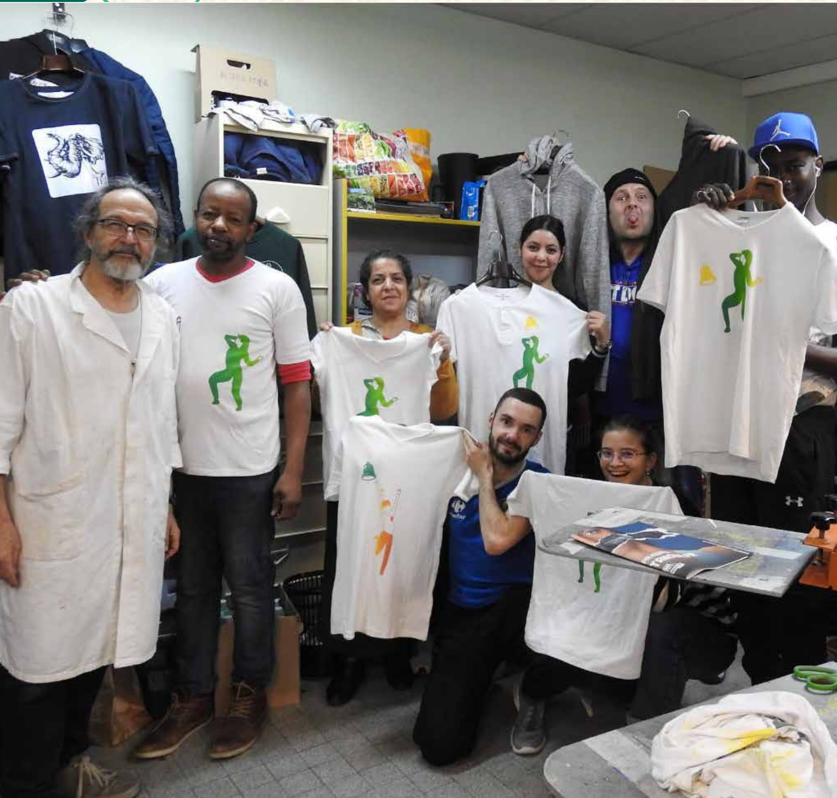
Atelier d'initiation avec les bénéficiaires de La Cloche qui lutte pour l'inclusion des personnes sans domicile

Alternatiba Paris est un mouvement composé de citoyen·nes qui ont à coeur de (se) former aux enjeux théoriques de la crise climatique et aux pratiques alternatives . L'atelier de sérigraphie en est un bon exemple, car l'équipe fondatrice n'avait aucune expérience de cette pratique à sa création !