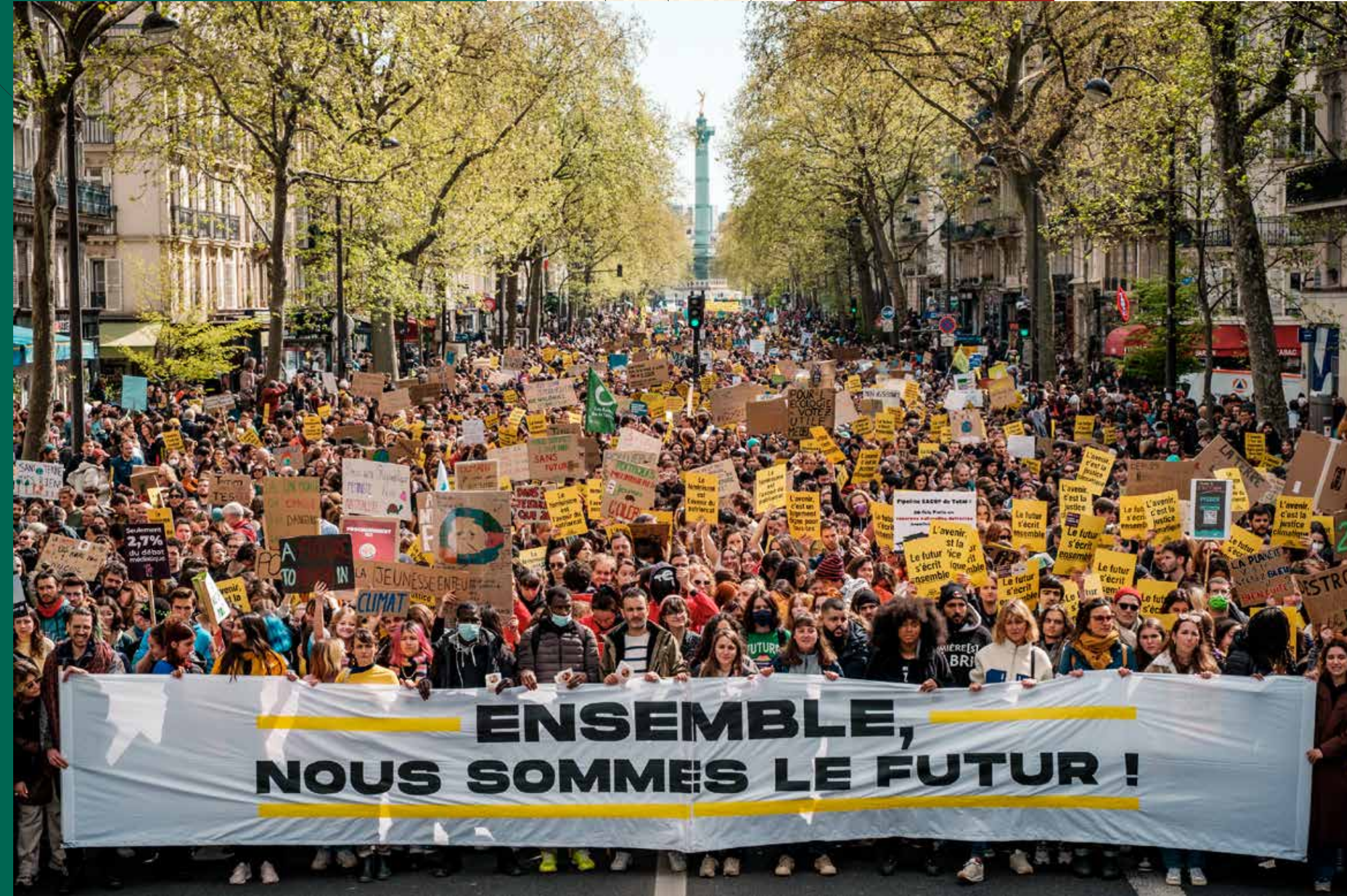
Marche pour le futur - Paris, Printemps 2022